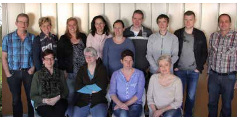
De ondernemingsraad met ingang van 9 december 2015: