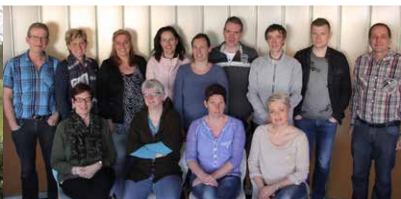
De ondernemingsraad met ingang van 9 december 2015: