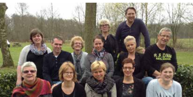
De ondernemingsraad van 1 januari tot 9 december 2015: