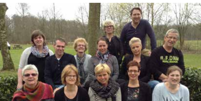
De ondernemingsraad van 1 januari tot 9 december 2015: